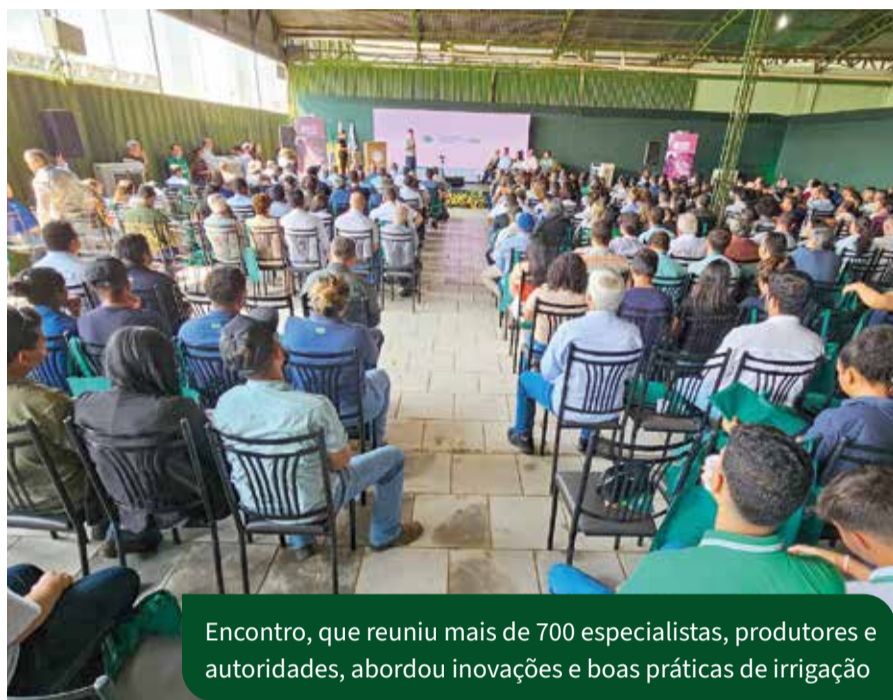
Encontro, que reuniu mais de 700 especialistas, produtores e autoridades, abordou inovações e boas práticas de irrigação