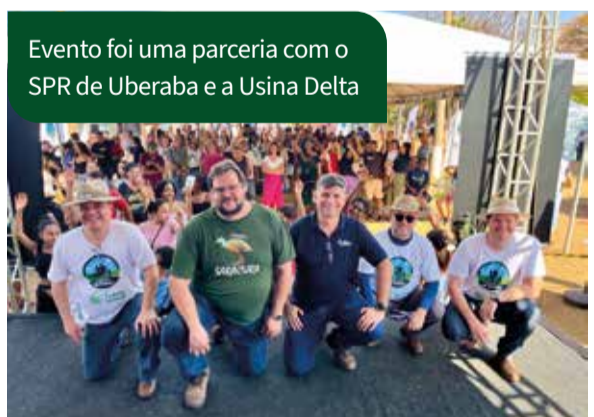
Evento foi uma parceria com o SPR de Uberaba e a Usina Delta