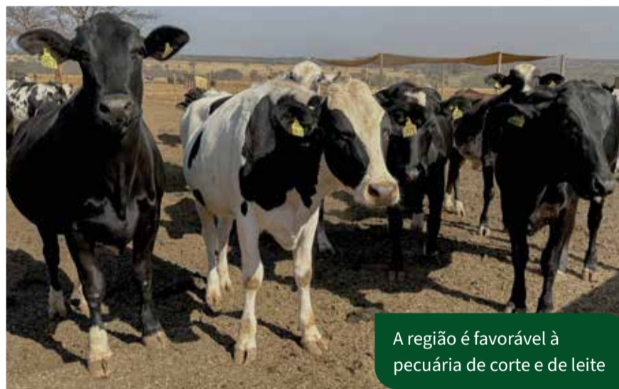
A região é favorável à pecuária de corte e de leite

O Banco do Brasil e a Embrapa estão atuando em parceria com os produtores, oferecendo suporte técnico e financeiro para o desenvolvimento de novas tecnologias e práticas agrícolas mais sustentáveis.