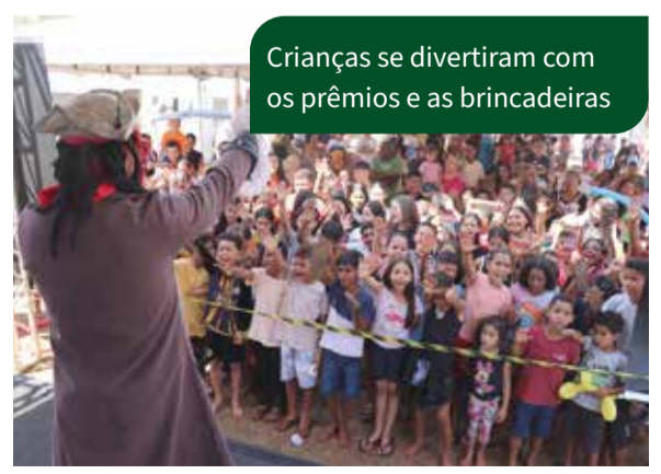
Crianças se divertiram com os prêmios e as brincadeiras