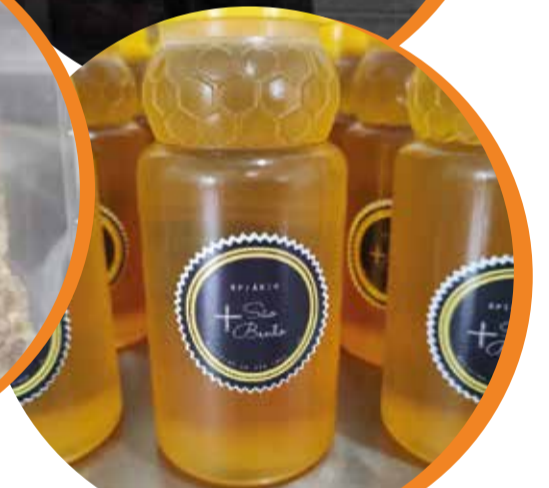
Atividade de apicultura começou no mosteiro na década de 1960; os produtos são vendidos na loja do mosteiro

“ Nossa vida mudou depois de conhecer o Sistema Faemg Senar. Foi aí que descobrimos cursos que podíamos fazer. ”