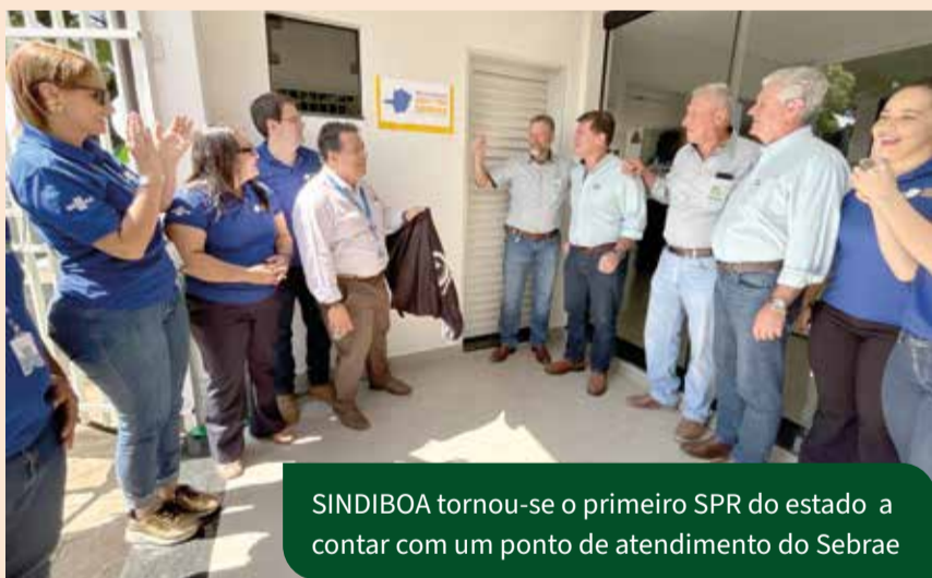
SINDIBOA tornou-se o primeiro SPR do estado a contar com um ponto de atendimento do Sebrae