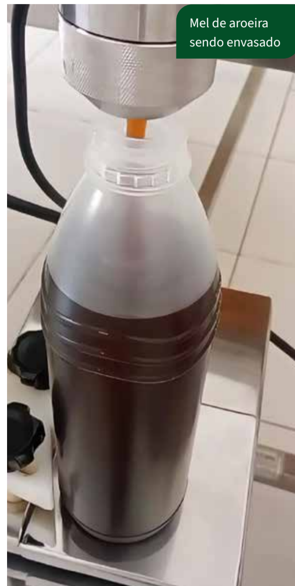
Mel de aroeira sendo envasado