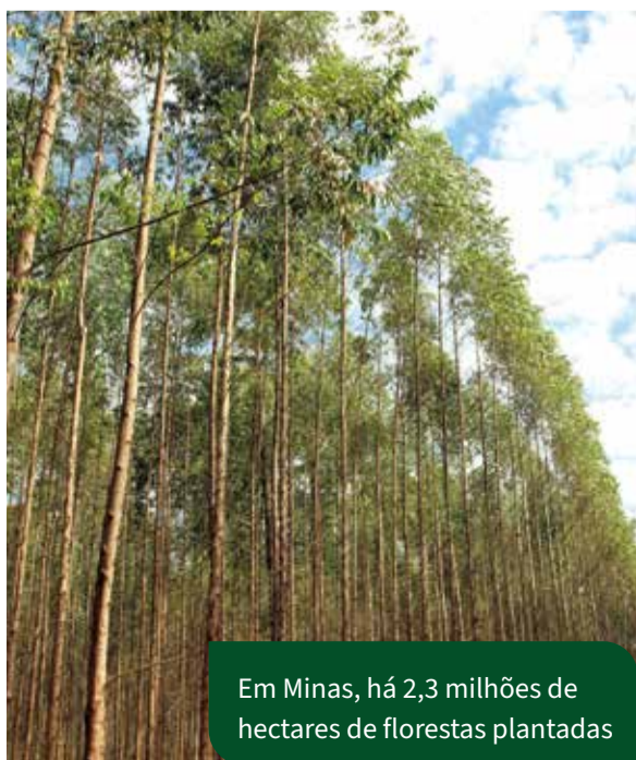
Em Minas, há 2,3 milhões de hectares de florestas plantadas

95% dos municípios mineiros serão favorecidos com as novas regras