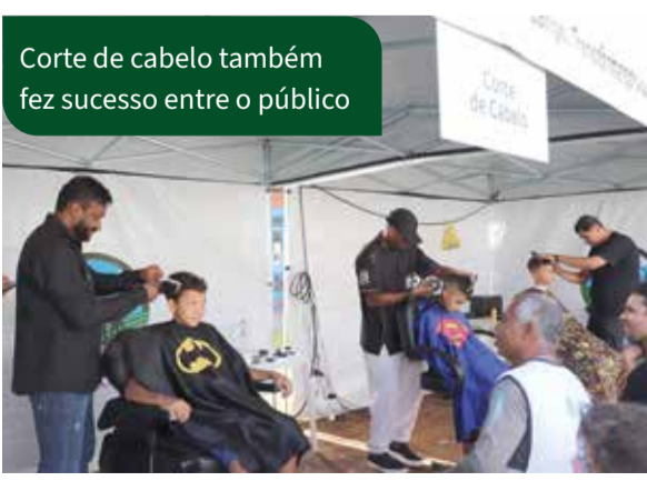
Corte de cabelo também fez sucesso entre o público