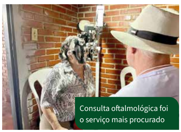
Consulta oftalmológica foi o serviço mais procurado