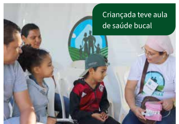
Criançada teve aula de saúde bucal