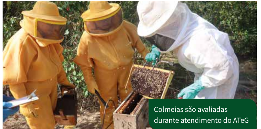
Colmeias são avaliadas durante atendimento do ATeG