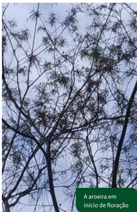
A aroeira em início de floração

O ATeG Apicultura é ofertado pelo Siste-