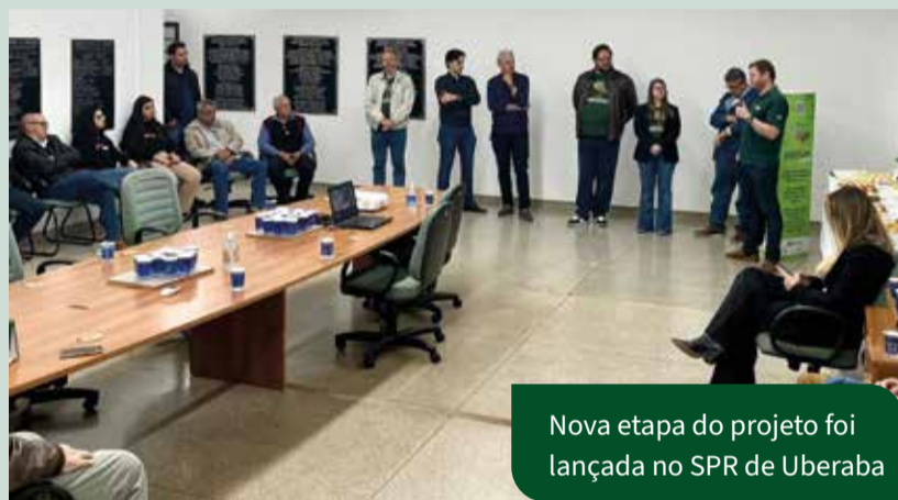
Nova etapa do projeto foi lançada no SPR de Uberaba

A iniciativa tem a parceria do Centro de Informações do Turismo Rural de Uberaba (Citur) e o apoio do Sistema Faemg Senar, Sindicomércio e Associação de Supermercados do Triângulo Mineiro (Assuper).