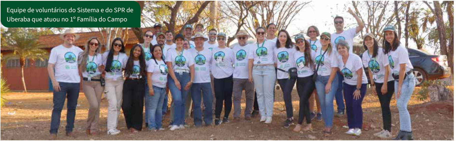
Equipe de voluntários do Sistema e do SPR de Uberaba que atuou no 1º Família do Campo