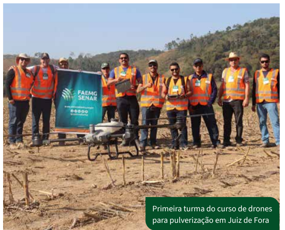
Primeira turma do curso de drones para pulverização em Juiz de Fora