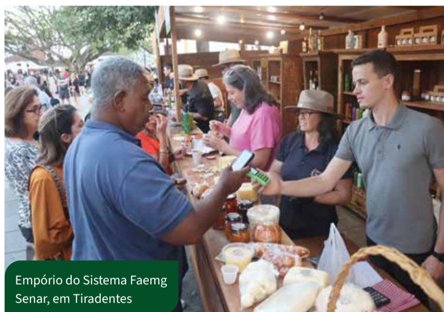
Empório do Sistema Faemg Senar, em Tiradentes