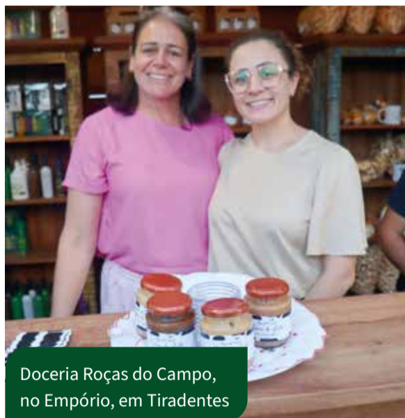
Doceria Roças do Campo, no Empório, em Tiradentes