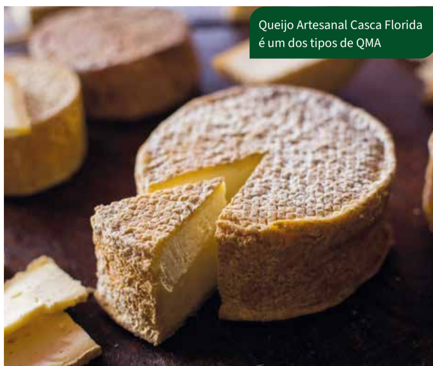
Queijo Artesanal Casca Florida é um dos tipos de QMA