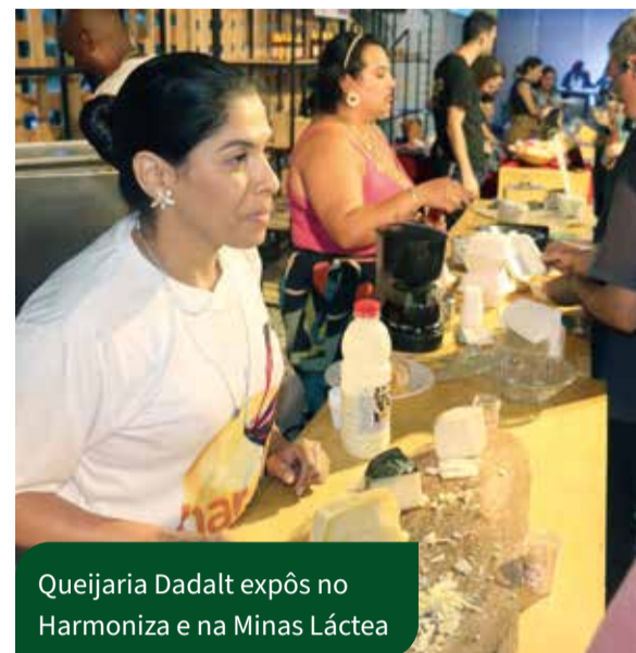
Queijaria Dadalt expôs no Harmoniza e na Minas Láctea