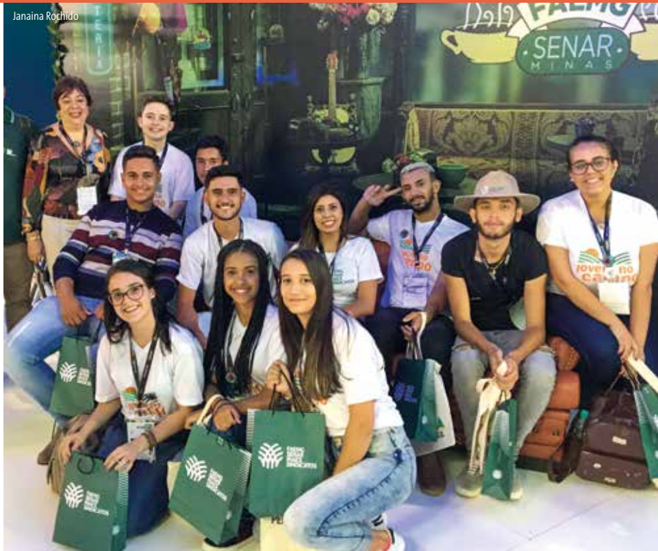
Turmas de Divino e Manhuaçu visitaram a Semana Internacional do Café este ano