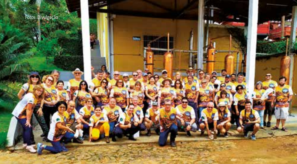
Amantes de jipe de todo o país percorreram a rota no Pico da Bandeira