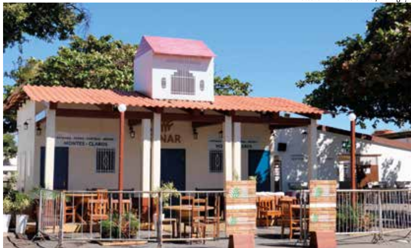
Estande na tradicional exposição agropecuária