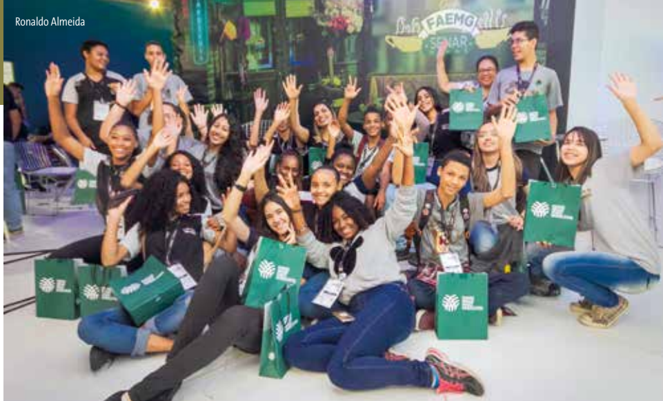
Cerca de 400 estudantes visitaram a SIC