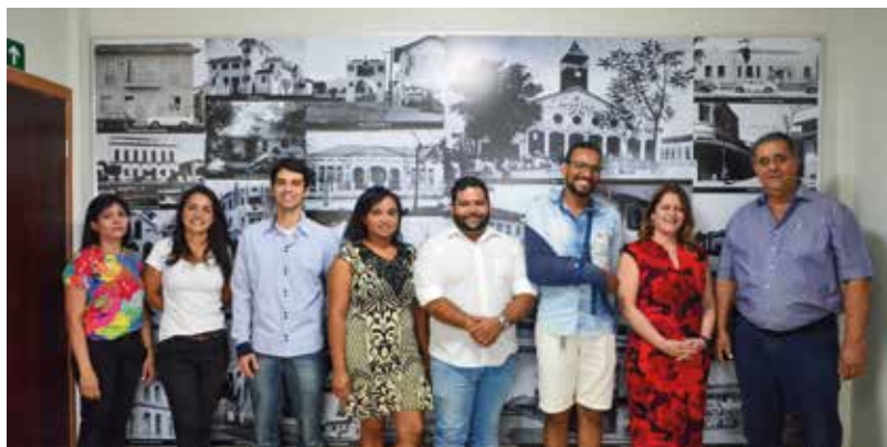
Equipe de funcionários do Sindicato de Montes Claros