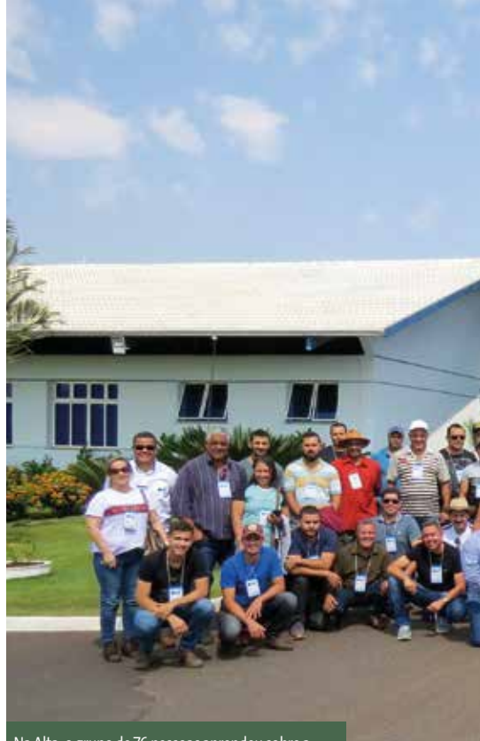
Na Alta, o grupo de 76 pessoas aprendeu sobre a genética adequada para produção de leite e de carne