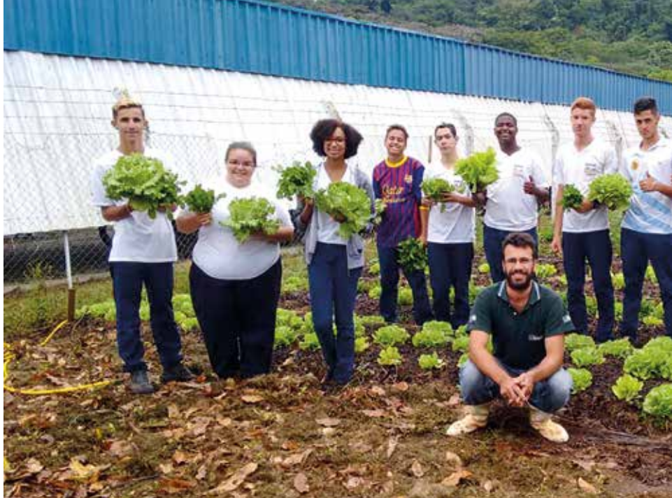
Turma promovida em parceria com a empresa MAHLE, em Itajubá, em 2017

O programa é voltado para jovens com idade entre 15 anos completos até 24 anos, que já tenham concluído ou estejam regularmente matriculados no ensino fundamental, médio ou no Programa de Educação de Jovens e Adultos (EJA), além de ter vínculo e afinidade com o meio rural.